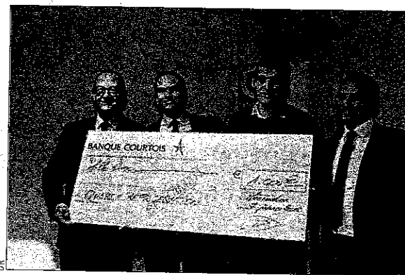
Quercy Réfrigération a gagné le trophée primo exportateur 2016.